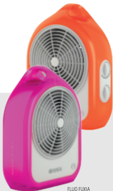
FLUO ORANGE Cod. 99575